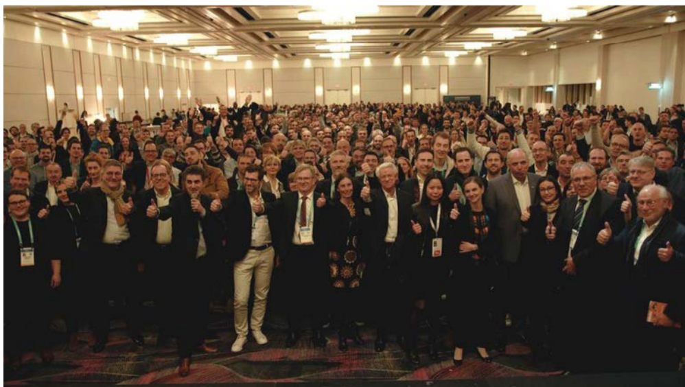
Session du Village Francophone en présentiel lors du CES 2020.

Cet événement, qui se déroule normalement en présentiel lors du CES (5e participation) et d'autres événements technologiques d'envergure, a pour vocation de connecter les écosystèmes numériques et les territoires de différents pays issus de la Francophonie tels que le Québec, le Grand-Duché du Luxembourg, la France, la Suisse, Tahiti, certains pays africains et la Wallonie. L'objectif affiché est de créer des corridors directs d'attractivité et d'accélération de champions technologiques entre territoires.